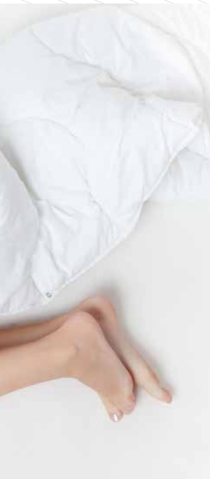
Standard Produktprogramm | Stock Yarn Counts: